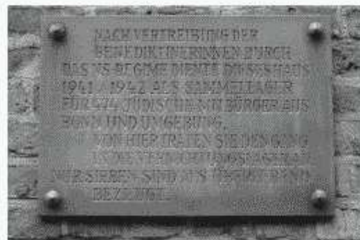
Eine Gedenktafel erinnert am Kloster an das Schicksal der ermordeten Juden.

Eine Gedenkveranstaltung auf möglichst breiter gesellschaftlicher Basis findet dieses Jahr wieder am 7. November um 18:30 Uhr am Kloster statt.