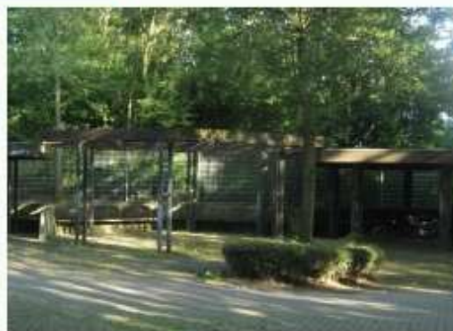
Auf Initiative der SPD Endenich/Weststadt wird der Unterstand im Endenicher Park nun beseitigt.