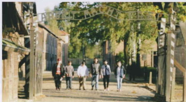
Die Jugendlichen beim Besuch des Lagers Auschwitz

Alle Endenicherinnen und Endenicher sind ganz herzlich zur Gedenkveranstaltung eingeladen!