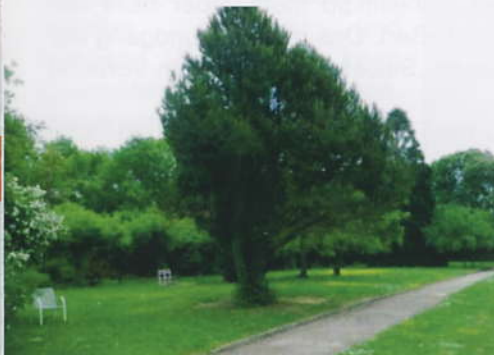
Der schöne Park soll dichter Bebauung zum Opfer fallen

Der Charakter des Parks mit seinem Alleecharakter würde damit unwiederbringlich zerstört. Aber auch die geringe Zahl an Pflegeplätzen sieht die SPD in Endenich kritisch. So sind künftig lediglich 24 Vollzeitpflegeplätze (vormals 106 Heimplätze) vorgesehen. Mit Blick auf die älter werdende Gesellschaft dürfte der Bedarf eher steigen. Schade, dass die Jamaika-Koalition ihre vielen Bekundungen zu Beginn des Planungsverfahrens wieder hat fallen lassen.