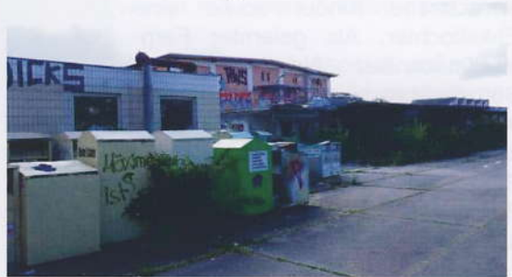
25 Jahre nach Ende des Schlachtbetriebs ist die Zukunft des Schlachthofgeländes immer noch ungewiss

Jetzt droht dem von SPD-Seite stets unterstützten Projekt Unbill von anderer Seite: Die sogenannte Störfallverordnung wurde verschärft. Es muss nun neu geprüft werden, ob die vorgesehenen Nutzungen im Umfeld der Müllverbrennungsanlage überhaupt noch rechtlich zulässig sind.