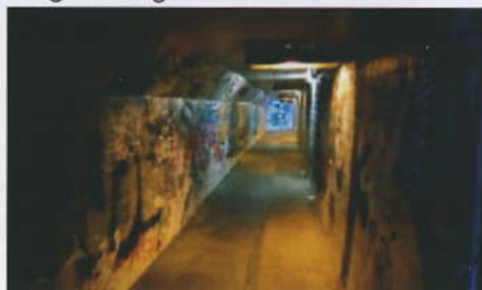
Wenig einladend: die Unterführung im heutigen Zustand

Nun aber steht eine grundlegende Änderung an. Ein Lichtband soll den Weg in die City fast taghell erleuchten. Außerdem wird die Unterführung verlängert. Denn an beiden Seiten werden Rampen gebaut, damit Radler, Kinderwagen, Rollstuhlfahrer bequem in die Innenstadt rollen können. Rund um die Ein- bzw. Ausgänge sollen kleine parkähnliche Anlagen entstehen. So wird das jetzt brachliegende Viktoriadreeck zwischen Endericher-, Herwarthstraße und Viktoriabrücke für alle zugänglich und der gesamte Bereich aufgewertet. Die genauen Pläne werden demnächst der Öffentlichkeit vorgestellt.